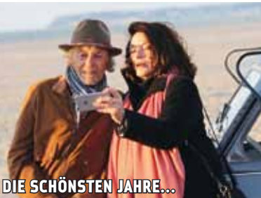
DIE SCHÖNSTEN JAHRE...