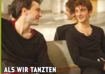
ALS WIR TANZTEN