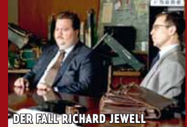
DER FALL RICHARD JEWELL