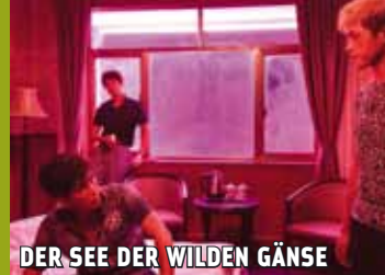
DER SEE DER WILDEN GÄNSE