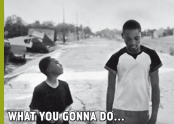
WHAT YOU GONNA DO...