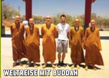
WELTREISE MIT BUDDAH