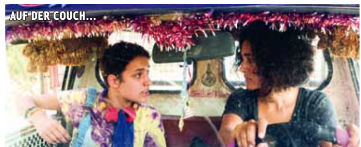
AUF DER COUCH...