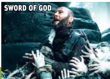
SWORD OF GOD