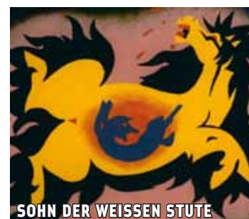
SOHN DER WEISSEN STUTE