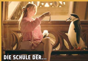
DIE SCHULE DER...