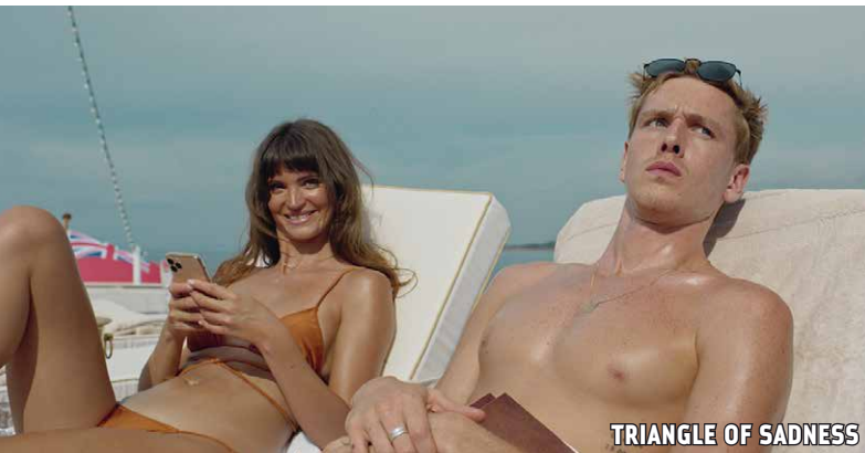
TRIANGLE OF SADNESS