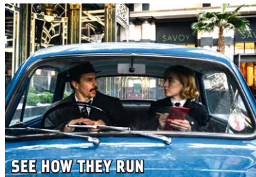
SEE HOW THEY RUN

Im Londoner West End der 1950er Jahre werden die ambitionierten Pläne für die Verfilmung eines erfolgreichen Theaterstücks plötzlich gestoppt, nachdem der unmoralische und als arrogant verschriene Regisseur des Stücks ermordet wird. Als der erfahrene und kluge Inspektor Stoppard und der eifrige Neuling Constable Stalker den Fall übernehmen, finden sich die beiden in einem rätselhaften Krimi im glamourösen, schmutzigen Theateruntergrund wieder – mit dem übereifrigen weiblichen Lehrling an seiner Seite wird die Geduld des Inspektors immer wieder auf die Probe gestellt. US 2022 | R Tom George | B Mark Chappell | D s.o., Ruth Wilson, Shirley Henderson | ab 12 J. | 98 Min. | BE