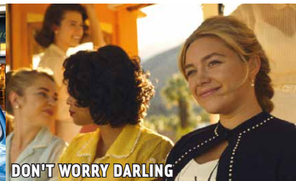
DON'T WORRY DARLING