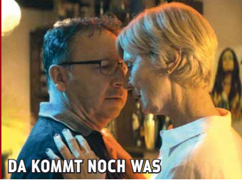
DA KOMMT NOCH WAS