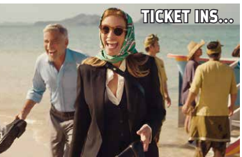
TICKET INS PARADIES

David und Georgia, ein geschiedenes Paar, reisen nach Bali, um Töchter Lily davon abzuhalten, denselben Fehler zu begehen, den sie vor 25 Jahren selbst gemacht haben... „Nach Best Exotic Marigold Hotel beweist Ol Parker erneut sein Faible für Feelgood-Komödien vor exotischen Idyllen!“ (epd-Film) USA 2022 | R & B Ol Parker | D s.o., Kaitlyn Dever, Maxime Bouttier, Lucas Bravo | ab 6 J. | 104 Min. | BE