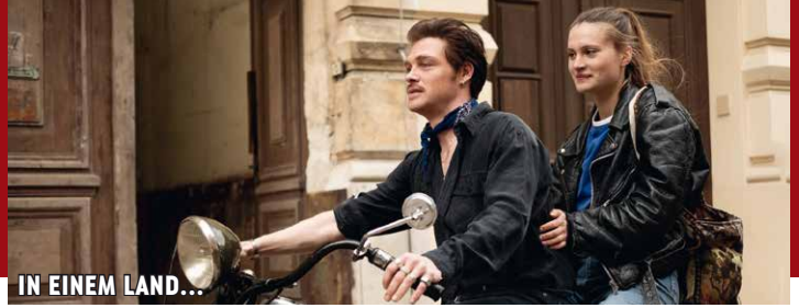
IN EINEM LAND...