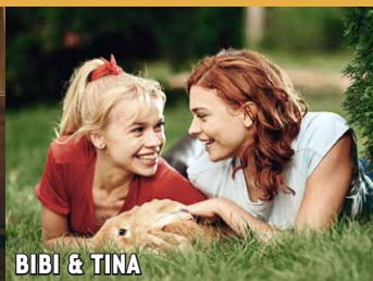
BIBI & TINA