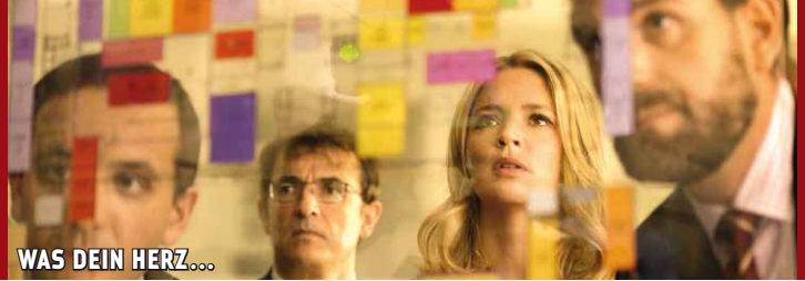
WAS DEIN HERZ...