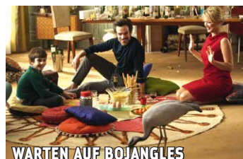
WARTEN AUF BOJANGLES