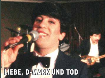
LIEBE, D-MARK UND TOD