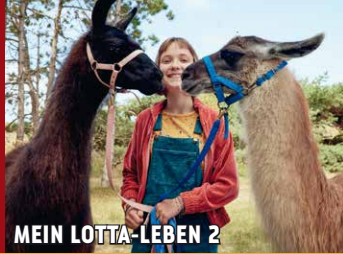
MEIN LOTTA-LEBEN 2