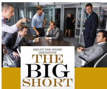
DIES IST EINE WAHRE GESCHICHTE THE BIG SHORT