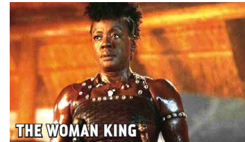
THE WOMAN KING

„Mitreißendes Historien-Action-Epos... Kraftvoll und emotional berauschend!“ (Slash Film) US/CA '22 | R & B Gina Prince-Bythewood | D s.o., Thuso Mbedu, Lashana Lynch | ab 12 J. | 135 Min. | BE