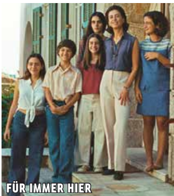
FÜR IMMER HIER

Oscar® für den Besten fremdsprachigen Film, Golden Globe für die Beste Hauptdarstellerin, Regiepreis in Venedig & Publikumspreis Miami Filmfestival.