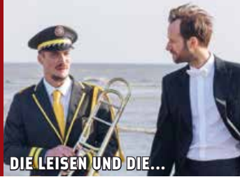
DIE LEISEN UND DIE...