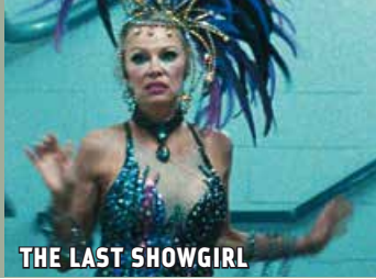
THE LAST SHOWGIRL