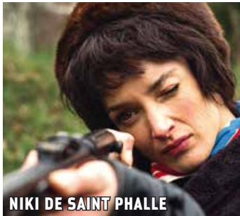
NIKI DE SAINT PHALLE