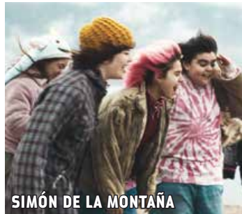
SIMÓN DE LA MONTAÑA