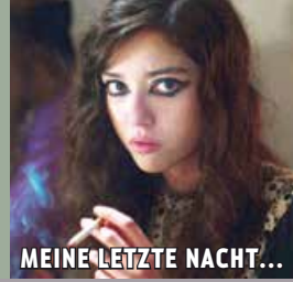
MEINE LETZTE NACHT...