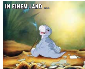
IN EINEM LAND ...

IR/USA 1988 | R Don Bluth | B Stu Krieger | K Jim Mann | M James Horner | ab 6 J./empf. ab 8 J. | 69 Min.