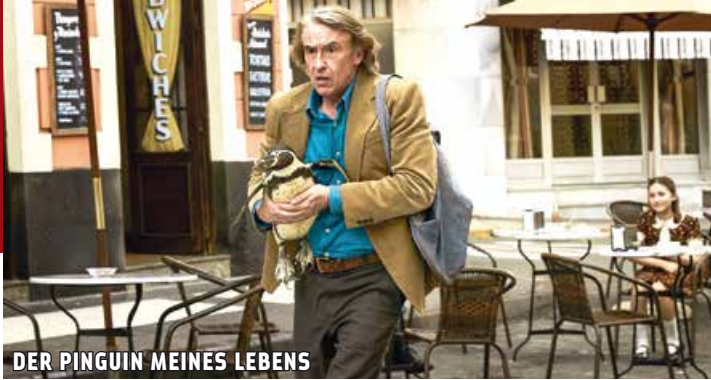
DER PINGUIN MEINES LEBENS