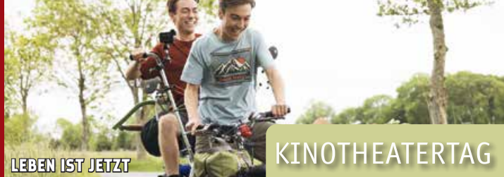
LEBEN IST JETZT