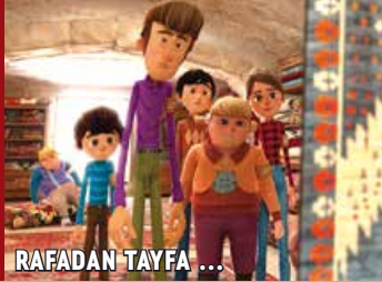
RAFADAN TAYFA ...