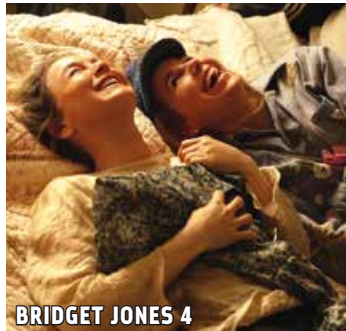
BRIDGET JONES 4