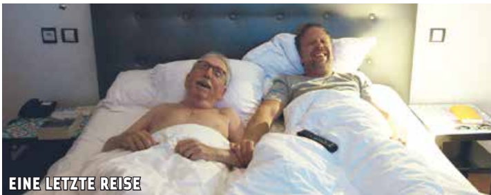
EINE LETZTE REISE

SW 2024 | R, B & K Filip Hammar, Fredrik Wikingsson | M Christian Olsson | ab 0 J. | 99 Min. | BE