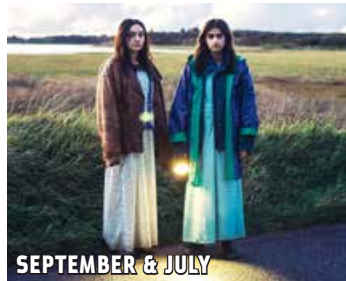
SEPTEMBER & JULY