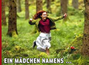
EIN MÄDCHEN NAMENS ...