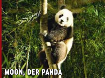
MOON, DER PANDA