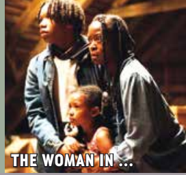
THE WOMAN IN ...

Fr., 18.04. um 16:15 Uhr TÜRK SINEMASI MUKADDERAT