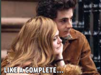
LIKE A COMPLETE...