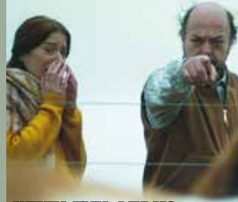
WHEN EVIL LURKS