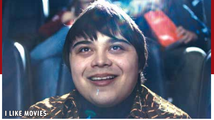
I LIKE MOVIES