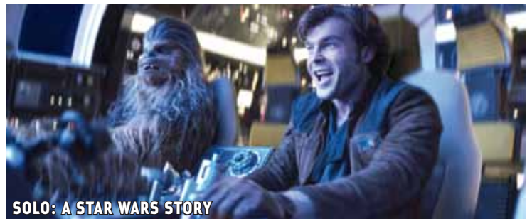
SOLO: A STAR WARS STORY