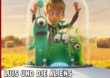
LUIS UND DIE ALIENS