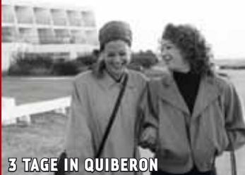
3 TAGE IN QUIBERON