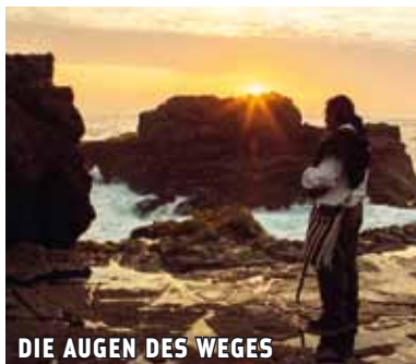
DIE AUGEN DES WEGES