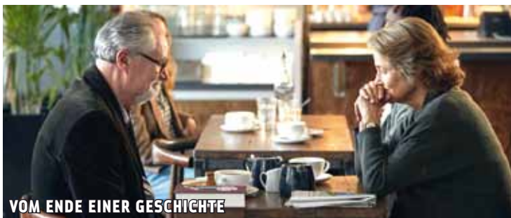
VOM ENDE EINER GESCHICHTE