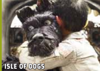
ISLE OF DOGS