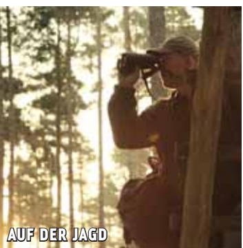
AUF DER JAGD