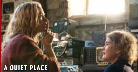
A QUIET PLACE