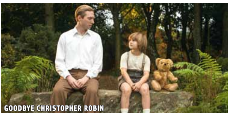
GOODBYE CHRISTOPHER ROBIN