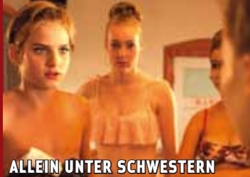
ALLEIN UNTER SCHWESTERN