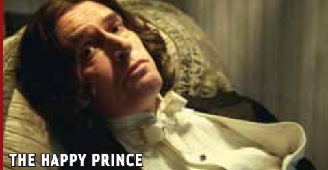
THE HAPPY PRINCE