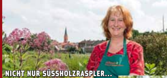
NICHT NUR SÜSSHOLZRASPLER...