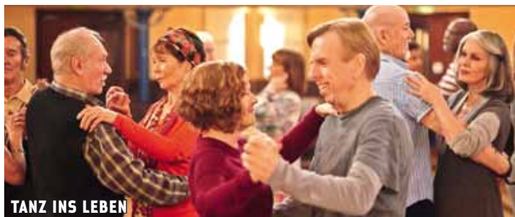
TANZ INS LEBEN