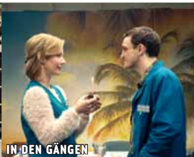
IN DEN GÄNGEN