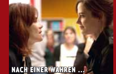
NACH EINER WAHREN ...