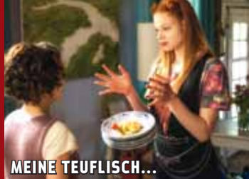
MEINE TEUFLICH... GUTE FREUNDIN