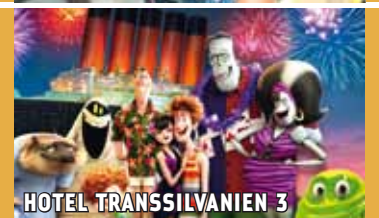
HOTEL TRANSILVANIEN 3