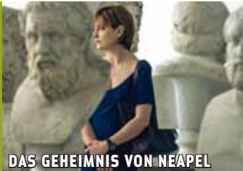
DAS GEHEIMNIS VON NEAPEL