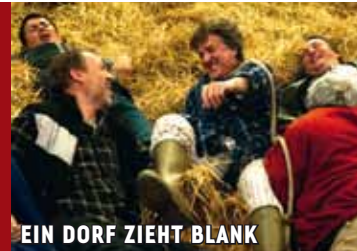
EIN DORF ZIEHT BLANK