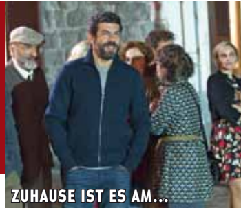
ZUHAUSE IST ES AM...