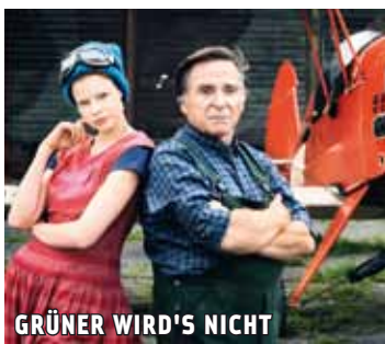
GRÜNER WIRD'S NICHT