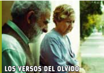
LOS VERSOS DEL OLVIDO