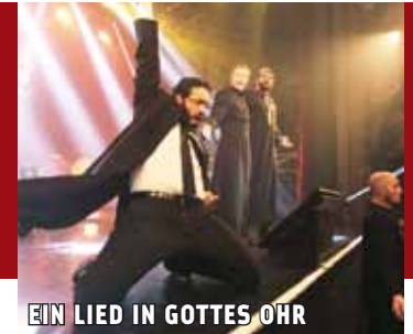
EIN LIED IN GOTTES OHR